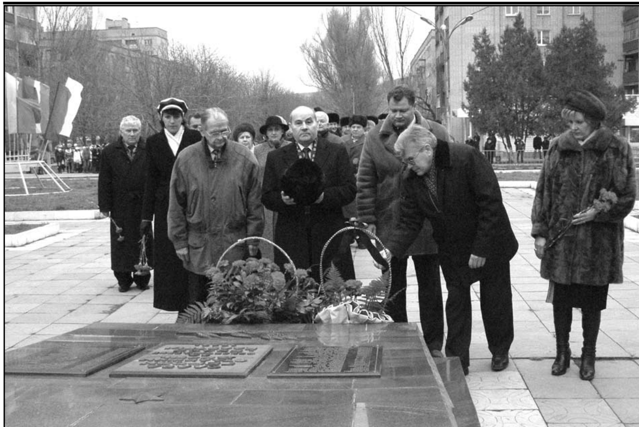
Возложение цветов к памятнику погибшим героям возле ж/д вокзала