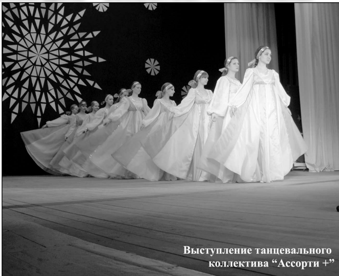
Выступление танцевального коллектива «Ассорти +»

МУЗЫКАЛЬНАЯ КАМПАНИЯ МАТРИЦА ПРЕДСТАВЛЯЕТ